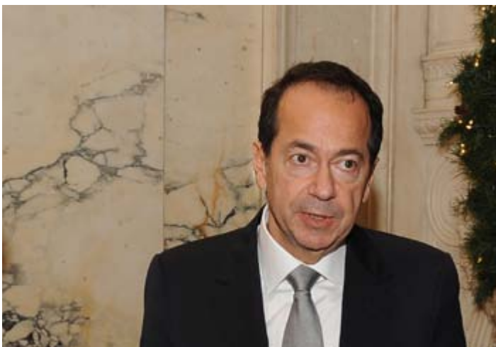
κ. John Paulson, President & Portfolio Manager, Paulson & Co. Inc.