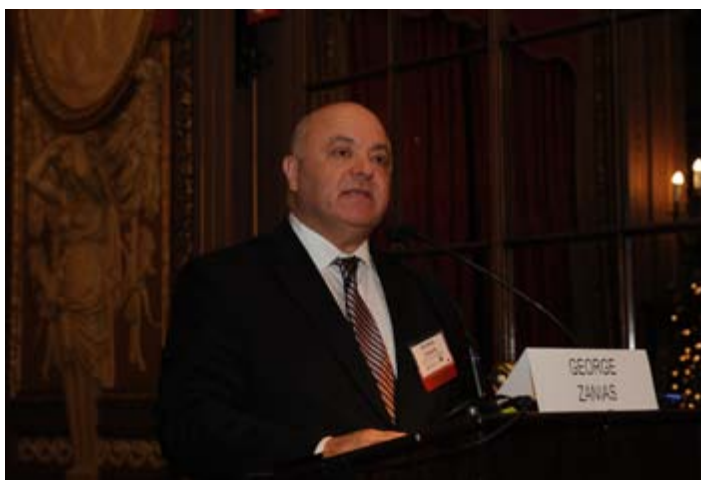
κ. Γιώργος Ζανιάς, Πρόεδρος, Εθνικής Τράπεζας της Ελλάδος και Ελληνικής Ένωσης Τραπεζών

σταθεροποιηθεί και αποκατέστησαν την ισχύ τους, ενώ λειτουργούν σε μια οικονομία που είναι τώρα σταθεροποιημένη και αναπτύσσεται. Η αποκατάσταση της δύναμης των τραπεζών επιτεύχθηκε μέσω δυο Αυξήσεων Μετοχικού Κεφαλαίου και άλλων δράσεων ενίσχυσης της κεφαλαιακής βάσης τους, καθώς και μέσω συγχωνεύσεων και μείωσης του λειτουργικού τους κόστους. Η αποκατάσταση της ισχύος τους επιβεβαιώθηκε από την πρόσφατη Asset Quality Review και τα stress tests της Ευρωπαϊκής Κεντρικής Τράπεζας. Σημαντικά buffers υπάρχουν για την αντιμετώπιση της τελευταίας πρόκλησης, που δεν είναι άλλη από την συνεχιζόμενη, αν και επιβραδυνόμενη αύξηση των μη εξυπηρετούμενων δανείων, ενώ η κερδοφορία τους αποκαθίσταται μέσω μείωσης του κόστους του ρίσκου, μέσω αξιοποίησης των συνεργειών που προκύπτουν από τις συγχωνεύσεις, καθώς και από τη μείωση των επιτοκίων καταθέσεων, την αποκατάσταση κάποιων προμηθειών και την σταδιακή αποκατάσταση χορήγησης δανείων.