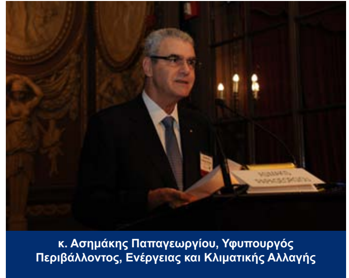
κ. Ασημάκης Παπαγεωργίου, Υφυπουργός Περιβάλλοντος, Ενέργειας και Κλιματικής Αλλαγής

κόπους και θυσίες η σταθερότητα και οι αναπτυξιακές προοπτικές της Ελλάδας. Όλα αυτά δεν μπορούμε να επιτρέψουμε να πάνε χαμένα για κανένα λόγο. Η Ελλάδα είναι οριστικά αναπόσπαστο κομμάτι της Ευρώπης και της Ευρωζώνης. Η Ελλάδα είναι οριστικά στο δρόμο της Σταθερότητας, της Ανάκαμψης και της Ανάπτυξης».