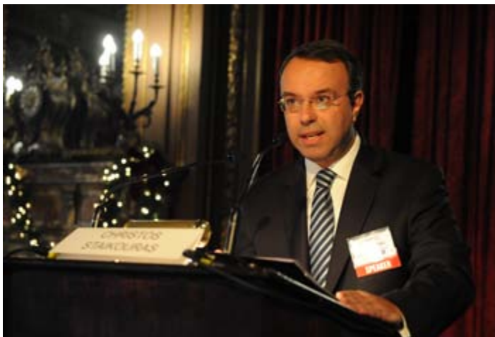
κ. Χρήστος Σταϊκούρας, Αναπληρωτής Υπουργός Οικονομικών