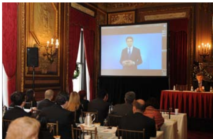
κ. Jyrki Katainen, Vice President European Commission Ομιλία μέσω webcast

Το Συνέδριο άνοιξε ο πρέσβης της Ελλάδας στις Ηνωμένες Πολιτείες, Χρίστος Παναγόπουλος ο οποίος μεταξύ άλλων δήλωσε τα εξής: «Στο πρώτο τέταρτο του 2014, η Ελληνική οικονομία σημείωσε πρόοδο 1.7%. Σύμφωνα με πρόσφατες αναφορές της Ευρωπαϊκής Επιτροπής, το 2015 η Ελληνική Οικονομία θα σημειώσει περαιτέρω ανάπτυξη 2.9% και το 2016 ανάπτυξη 3.7%. Για πρώτη φορά μετά από πολλές δεκαετίες, ο προϋπολογισμός θα δείξει πρωτογενές πλεόνασμα, τόσο στο φορολογικό όσο και σε τρεχούμενους λογαριασμούς. Ως αποτέλεσμα της παραπάνω «μακροοικονομικής βελτίωσης», σε συνδυασμό με το εκτεταμένο πρόγραμμα διαρθρωτικών μεταρρυθμίσεων, η θέση της Ελλάδας βελτιώθηκε κατά 17 θέσεις, όπως αναφέρει η έκθεση της Παγκόσμια Τράπεζας για την Επιχειρηματικότητα στο 2014. Το πρόγραμμα ιδιωτικοποιήσεων προχωρεί και η πρόσφατη προσφορά για τα περιφερειακά αεροδρόμια δείχνει το αυξανόμενο ενδιαφέρον των διεθνών επενδυτών. Η ελληνική οικονομία αυτή τη στιγμή αλλάζει με ταχείς ρυθμούς και γίνεται ένας προορισμός που οι διεθνείς επενδυτές αξίζει να εξετάσουν».