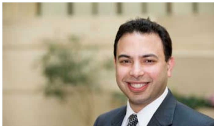
κ. Rishi Goyal, Mission Chief For Greece of International Monetary Fund (IMF)

αναιμική και ο πληθωρισμός παραμένει σε χαμηλά επίπεδα. Τα δεδομένα στην Ελλάδα συνεχίζουν να βγαίνουν καλύτερα ακόμη και από την ανοδική μας πρόβλεψη. Αλλά οι πολιτικοί κίνδυνοι ελλοχεύουν και έχουν σταθμιστεί με ελληνικά περιουσιακά στοιχεία (και πιθανότατα να συνεχίσουν να το κάνουν)».