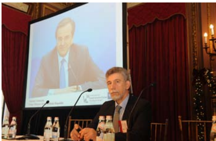
κ. Αντώνης Σαμαράς, Πρωθυπουργός της Ελλάδας Ομιλία μέσω webcast