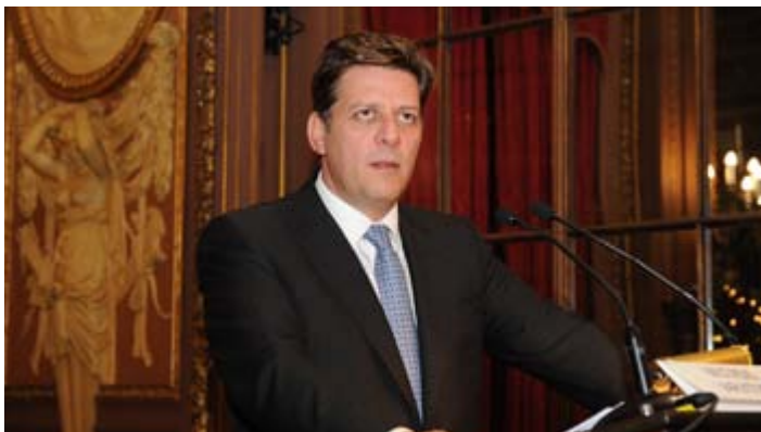
κ. Μιλιάδης Βαρβιτσιώτης, Υπουργός Ναυτιλίας και Αιγαίου

ότι κατά τη διάρκεια της εποχής της προβληματικής ελληνικής οικονομίας, ήταν ο μόνος τομέα στην Ελλάδα που δεν έφτασε σε υψηλά επίπεδα ανεργίας. Χωρίς καμία αμφιβολία, η ναυτιλία έχει αναγνωριστεί ως ένα μη-διαπραγματεύσιμο, ιστορικό, εθνικό, οικονομικό και στρατηγικό πλεονέκτημα, το οποίο πρέπει να παραμείνει ανταγωνιστικό. Επίσης τόνισε ότι «η Ελλάδα αλλάζει στο πλαίσιο μιας συνολικής στρατηγικής για την οικονομική ανάπτυξη και τη δημιουργία νέων κερδοφόρων επενδύσεων, συμπεριλαμβανομένου του τομέα των λιμανιών, αναμένει ότι η συνεχιζόμενη διεθνής ανταγωνιστική διαδικασία υποβολής προσφορών για την απόκτηση των μετοχών του κεφαλαίου των μεγάλων ελληνικών λιμανιών του Πειραιά και της Θεσσαλονίκης, θα οδηγήσει σε μια αμοιβαία επωφελή συμφωνία, τόσο για την Ελλάδα και τους επενδυτές και, μεταξύ άλλων, θα ενισχύσει τη θέση και τον ρόλο των Ελληνικών λιμανιών και τις δυνατότητες ανάπτυξης τους ως κόμβοι και διαμετακομιστικά κέντρα για την Ανατολική Μεσόγειο, τα Βαλκάνια και την Κεντρική Ευρώπη. Το εξαιρετικά επιτυχημένο παράδειγμα των επενδύσεων της COSCO στο λιμάνι του Πειραιά, το οποίο σύμφωνα με τη νέα συμφωνία που υπογράψαμε την περασμένη εβδομάδα αναμένεται να φτάσουν τα 230 εκατομμύρια ευρώ, ανοίγει το δρόμο».