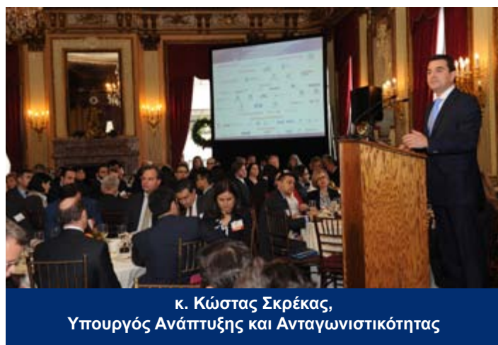
κ. Κώστας Σκρέκας, Υπουργός Ανάπτυξης και Ανταγωνιστικότητας

Κεντρικός ομιλητής στο μεσημεριανό γεύμα ήταν ο Υπουργός Ανάπτυξης και Ανταγωνιστικότητας κ. Κώστας Σκρέκας. Ο Υπουργός δήλωσε κατά τη διάρκεια της ομιλίας του: «Αφότου η κρίση χτύπησε τη χώρα το 2009, η Ελλάδα σχεδίασε και εφάρμοσε μία φιλόδοξη στρατηγική με δύο όψεις: διαρθρωτικές μεταρρυθμίσεις και δημοσιονομική προσαρμογή. Η ελληνική κυβέρνηση μετά το 2012, για πρώτη φορά εδώ και μία γενεά, οδηγεί την ελληνική οικονομία σε πρωτογενές πλεόνασμα της γενικής κυβέρνησης για το 2015 και σε κυκλικά προσαρμοσμένο πρωτογενές πλεόνασμα, το οποίο για το 2015 υπολογίζεται να είναι το υψηλότερο στον κόσμο. Και συνεχίζουμε τον ίδιο ρυθμό των μεταρρυθμίσεων του διοικητικού και επιχειρηματικού περιβάλλοντος. Μέσα σε μόλις σε ένα χρόνο η Ελλάδα ανέβηκε 111 θέσεις στην έκθεση “Ease of Doing Business Index” της Παγκόσμιας Τράπεζας: από την 147η θέση το 2013 στην 36η το 2014. Τον Νοέμβριο του 2014 καταργήσαμε τις άδειες λειτουργίας σε 103 επιχειρηματικούς τομείς επί συνόλου 404, αίροντας με αυτόν τον τρόπο τα γραφειοκρατικά εμπόδια που ορθώνονταν στην υγιή επιχειρηματικότητα. Πρόκειται για μεγάλη αλλαγή στην ελληνική διοικητική κουλτούρα. Και συνεχίζουμε!»